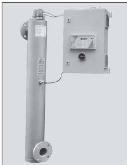
Bewades 400W200/17 HI